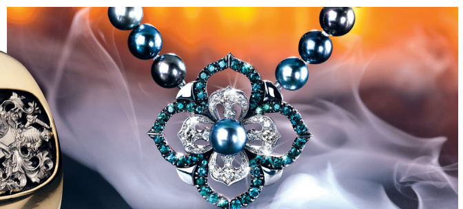
Grosser Anhänger in Palladium 950 mit farbwechselnden Granaten, braunen Diamanten und einer Tahitiperle Gewicht: Palladium 17.4gr Granate: 4,07ct | Diamanten: 1.48ct.