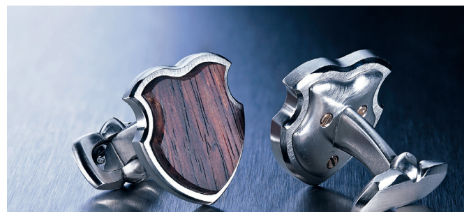
Manschettenknöpfe in Edelstahl mit Cocobolo-Holz verschraubt mit 6 Schrauben aus Rotgold 750.