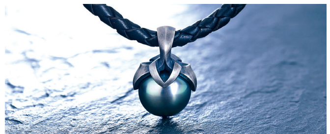
Perlenanhänger mit einer grossen Tahiti-Perle Ø 13.3mm «Fassung» in Weissgold 750 schwarzhodiniert und mattiert.